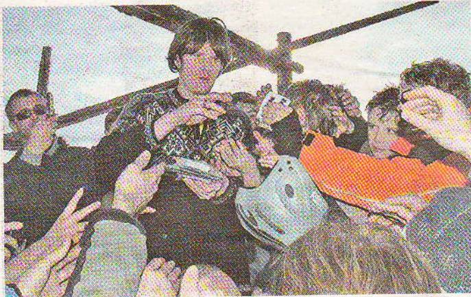
Hier wirkt Mickie Krause etwas überfordert. Kein Wunder, hunderte Fans bettelten den „König von Mallorca“ um ein Autogramm an.