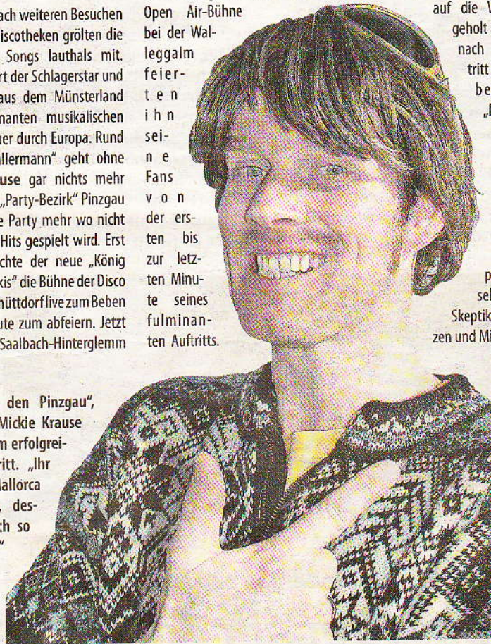
„Ich rocke den Pinzgau“, freut sich Mickie Krause nach seinem erfolgreichen Auftritt. „Ihr seit das Mallorca der Alpen, deshalb bin ich so gerne hier!“